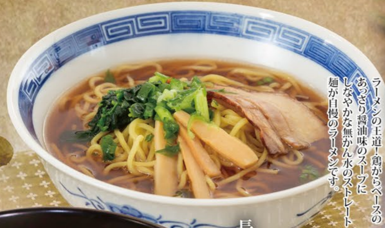
あつさり醤油ラーメン

ラーメンの王道！鶏からべーすのあつさり醤油味のスープに、しなやかな無かん水のストリート麺が自慢のラーメンです。